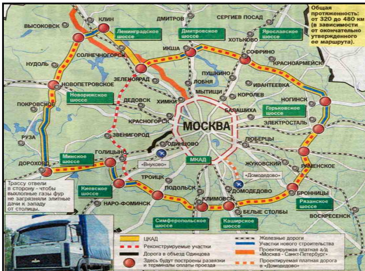
Рис. 1. / Fig. 1. Центральная кольцевая автомобильная дорога / Central Ring Road