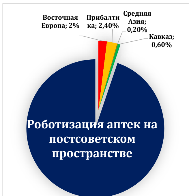
Рис. 2. / Fig. 2. Роботизация аптек на постсоветском пространстве / Robotization of pharmacies in the post-Soviet space