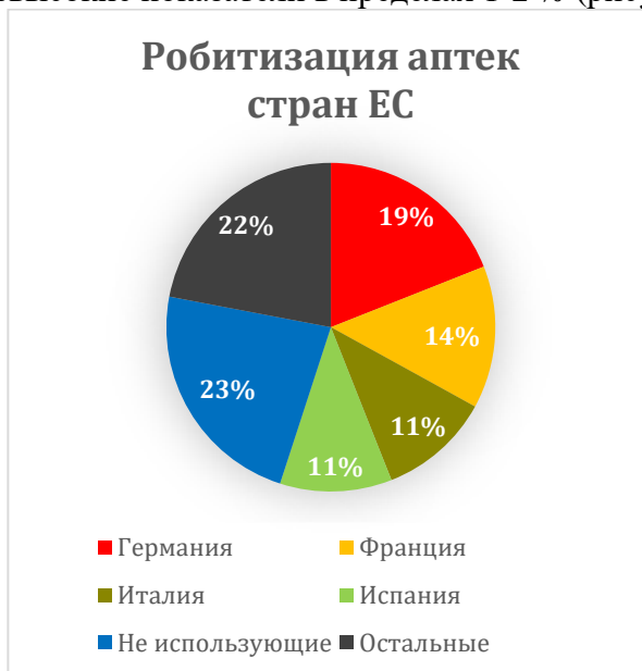
Рис. 1. / Fig. 1. Робитизация аптек стран ЕС / Robotization of pharmacies in EU countries

То, что касается оснащения аптечными роботами учреждений России и стран СНГ, то на сегодня – это совсем невысокие показатели в пределах 1-2 % (рисунок 2).